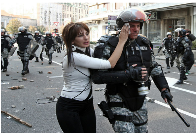
Humanost na „Paradi ponosa 2010“

Policijski službenici u Srbiji su poslednjim izmenama Zakona o policiji dobili mogućnost da samostalno odbiju da rade ukoliko nemaju sve uslove da izvrše zadatak ili im je život ugrožen. Najave i realizacija štrajka policajaca proteklih godina u Srbiji je dokaz da oni nisu zadovoljni svojim trenutnim položajem jer nemaju uslove da normalno obavljaju svoj posao. Visiko rizični događaj kao što je održavanje Parade ponosa direktno ugrožava život policijskog službenika. Time su ispunjeni svi uslovi za odbijanje rada policajaca. Ovakva zakonska odredba je u potpunosti suprotna ideji i misiji policijske službe, ali i viziji razvoja MUP da deluje kao servis svih građana garantujući bezbednost.