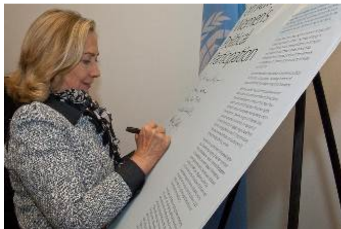
Hilari Klinton potpisuje zajedničku izjavu

Doprinos žena u održavanju međunarodnog mira i bezbednosti, ostvarivanju koncepta održivog razvoja i iskorenjivanju gladi i bolesti dokazan je više puta tokom istorije, ali to nije bilo dovoljno da se ženama i u praksi, a ne samo na papiru, omogući ostvarivanje prava na političku participaciju i donošenje odluka na svetskom, regionalnom, nacionalnom i lokalnom nivou.