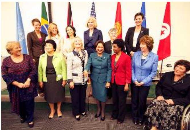
Političke liderke u UN potpisnice izjave

mir. Pored toga, u izjavi se države podsećaju da je učestvovanje žena u politici jedno od ljudskih prava, i pozvaju da preduzmu odlučne korake ka promovisanju jednakog učešća žena u političkom životu. Takođe, naglašava se značaj učestvovanja žena u politici, kako za vreme mira i rata, tako i tokom različitih nivoa političke tranzicije kroz koju jedna država prolazi. Posebno se pozivaju postkonfliktne i države u tranziciji da identifikuju i uklone sve diskriminatorne barijere sa kojima se žene suočavaju. Potpisnice izjave pozvale su sve države da ratifikuju i ispune svoje obaveze iz Konvencije UN o eliminaciji svih vidova diskriminacije žena, kao i da implementiraju Rezoluciju Saveta bezbednosti 1325 o ženama, miru i bezbednosti.