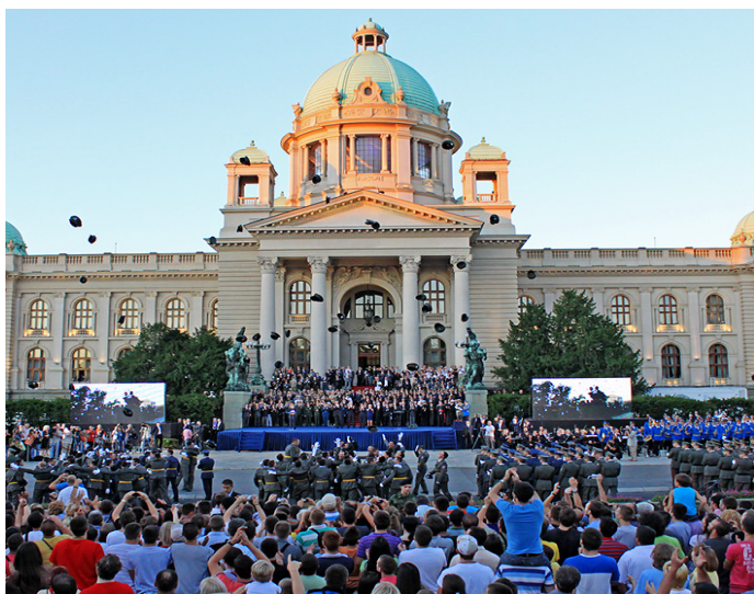
131. i 132. klasa Vojne akademije proslavlja završetak školovanja

Četvorogodišnje obrazovanje 131. i 132. klase Vojne akademije krunisano je svečanošću koja je održana 10. septembra 2011. godine ispred Doma narodne skupštine. Da je ovaj dan za pamćenje svedoči i činjenica da je, pored 108 potporučnika, po prvi put u istoriji Vojske Srbije u čin potporučnice promovisano 19 kadetkinja, koje su svoje obrazovanje na Vojnoj akademiji u Beogradu započele 2007. godine.