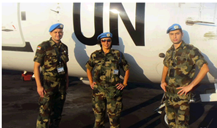
Pripadnici VS u mirovnoj misiji u DR Kongo, izvor: veb-sajt Vojske Srbije

Policija još od 1972. godine na Višoj školi unutrašnjih poslova školuje žene (do 2001. godine činile su do 10% sastava), dok mogućnost zapošljavanja u policiji posle završenog kursa uniformisane policajke stižu 2001. godine. Procenat žena u policiji i MUP-u od tada kontinuirano raste raste, tako da danas žene čine oko 21% zaposlenih (Rod i reforma sektora bezbednosti 2010).