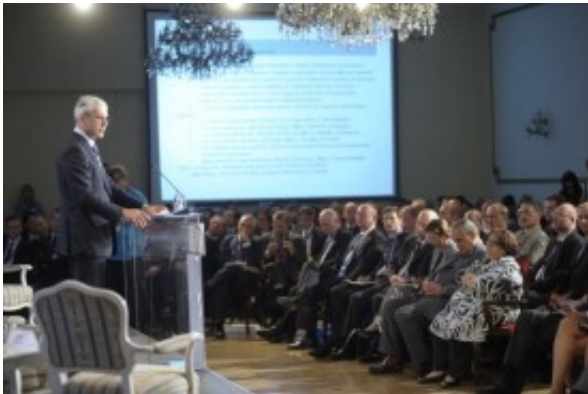
Uvodno obraćanje predsednika Tadića

Prvi Beogradski bezbednosni forum je ugostio 70 diskutanata, među njima 20 mladih naučnika iz regiona i preko 200 domaćih i stranih zvaničnika, predstavnika Evropske unije, NATO, istraživačkih i naučnih instituta, građanskog društva, parlamentaraca i novinara.