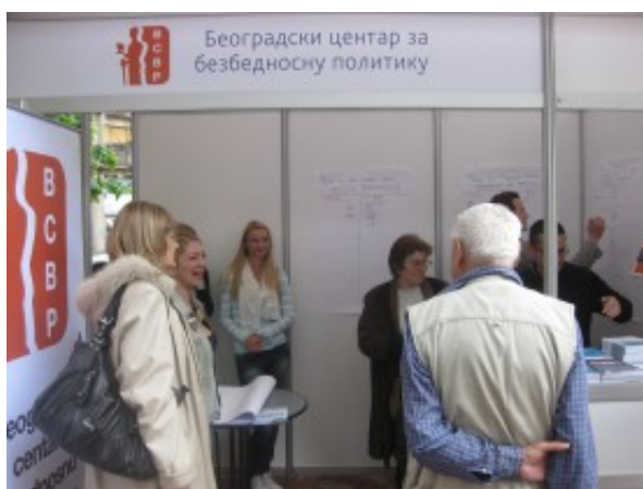
Štand BCBP na sajmu SAMOinicijativa

Pored glasanja na štandu su se vodile i zanimljive rasprave u vezi sa problemima u sektoru bezbednosti, a posetioci su posebno bili zainteresovani za naslove „Savetnici za rodnu ravnopravnost u sektoru bezbednosti u Srbiji“ i „Javnost Srbije o bezbednosti“. Studenti su iskoristili priliku da se detaljno informišu o programu stažiranja u BCBP, dok je ne mali broj prolaznika prilazio štandu i samo kako bi izrazivali nezadovoljstvo trenutnim stanjem u zemlji.